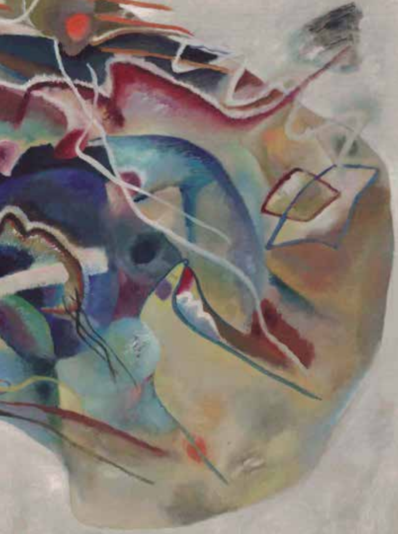
Vasily Kandinsky Pintura con borde blanco, 1913. Óleo sobre lienzo 140,3 x 200,3 cm, Solomon R. Guggenheim, Museum, Nueva York.

te que este dibujo simple nos lleva a un determinado recorrido que atraviesa gustos, placeres, ambientaciones, prácticas, etc, diría que la imaginación vuela porque la cantidad de asociaciones y deducciones que podemos lograr es prácticamente infinita.