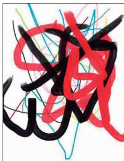
Pintura de un mono

Los grandes grupos del arte pictórico son: figurativo, semi figurativo y abstracto. Si bien el arte abstracto es complejo, también suele serlo el figurativo o semi figurativo. Tomemos como ejemplo un pintor del Renacimiento, El Bosco. En su obra "El Jardín de las delicias" (se cree del 1515) transmite un mensaje de muy alta complejidad, tanto que resulta imposible comprenderlo con una sola mirada y en el transcurso del tiempo se han formulado diversas tesis acerca de su planteo temático, psicológico y plástico, sin arribar aún a un consenso. Su contenido simbólico y una composición caótica, dividió las opiniones de los estudiosos en distintas épocas. Algunos se sienten desbordados por la incomprensión del tríptico, al asociárselo a Disney... pero, entiéndase bien, cualquiera sea la interpretación que se le dé, es una obra monumental. Creo que para todo necesitamos estimular la curiosidad y disponer de información. Kandinsky y Pollock nos están esperando al lado de otros creadores.